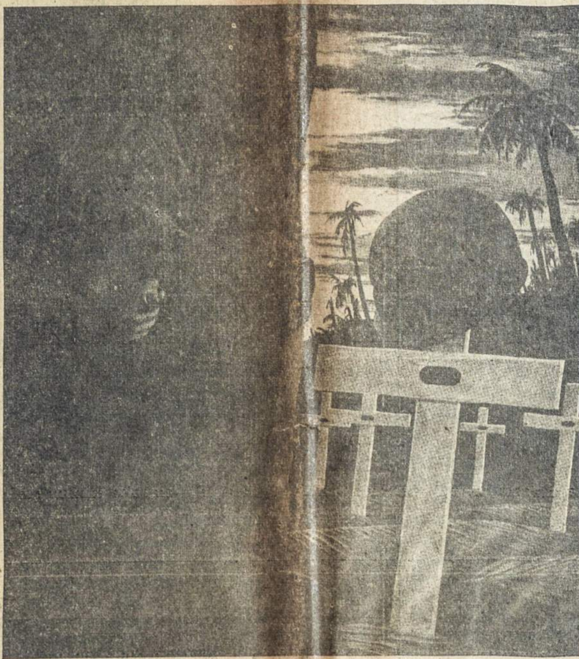
LIETUVOS PARTIZANŲ KAPAI