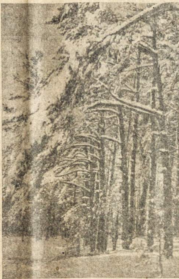
Lietuvos miške žiema