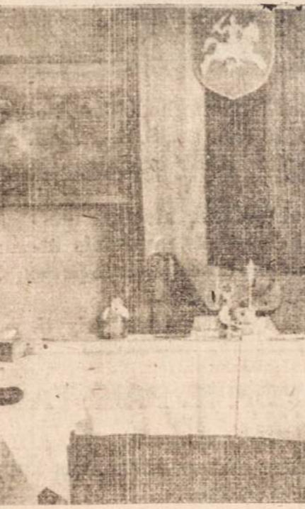
Lietuvių tautodailės parodas belankvėdami, neviendais užsienietis ste bėdavosi Lietuviškoju menu.