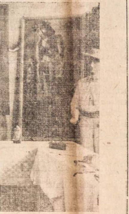
Lietuvių tautodailės parodas belankvėdami, neviendais užsienietis ste bėdavosi Lietuviškoju menu.

"Laiką" mes anksčiau žinojom kaip mėnesinį Argentinos lietuvių žurnalą. Šiandien mūsų minimas "Laikas" išleido pirmą savo, kaip dvasiaitinio laikraščio numerį. Su džiaugsmu reikia pastebėti, jog pirmasis numeris iš tikrųjų yra stiprus.