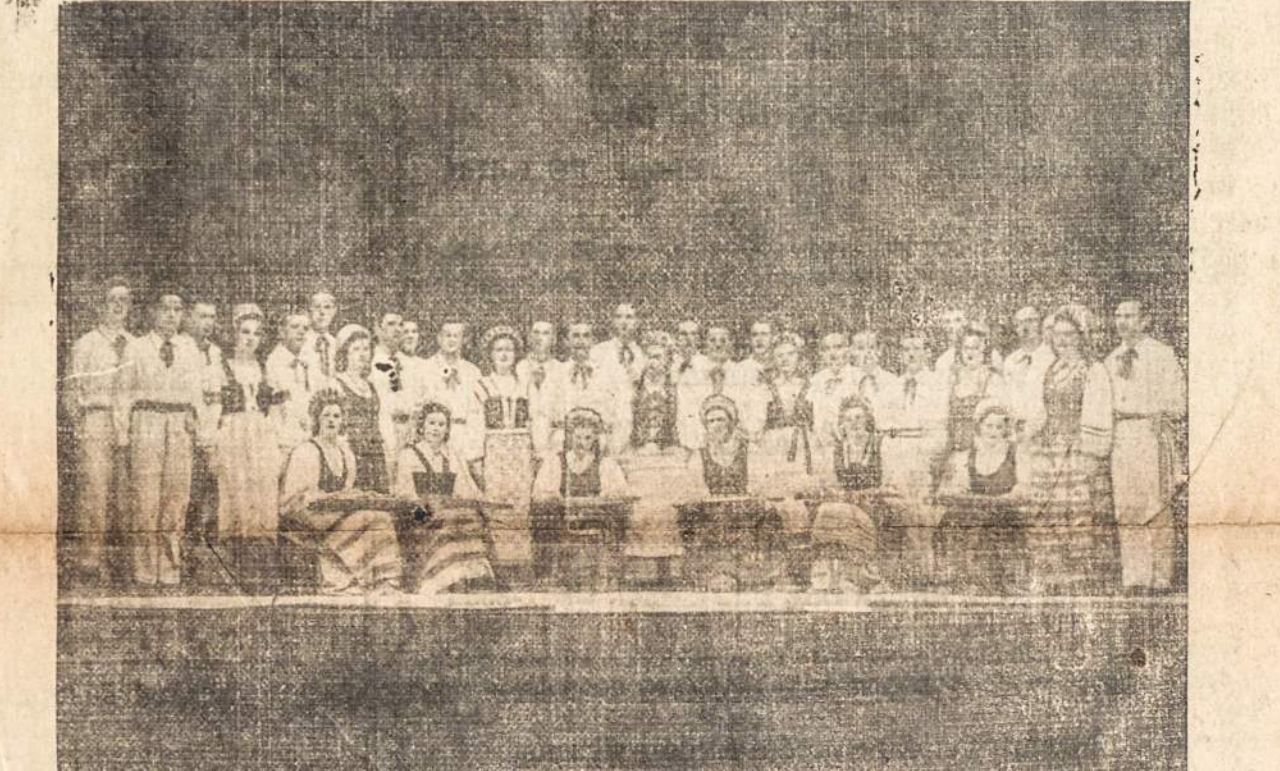
"Ciurlionio" ansamblis, kuris taip šauniai pirmą kartą koncertavo kovo 26 d. Clevelande. Bandžio 30 d. ansamblis koncertuos Pittsburghe. Koncerto bilietų galima gauti "Lietuvių Žinių" administracijoje

Didžiai teigiamas reikšmės lietuviškam gyvenime turi abu Argentinose lietuvių laikraščiai: "Argentinose Lietuvių Balsas" ir "Laikas", kurie nors truputį ir patalauja skaitytojams, tačiau apskritai šiuo metu yra stiprus tiek savo turiniu, tiek savo vedama lietuviška linija. Čia iškeltos kelios mintys nors truputį skaudokos, tačiau vertos giliosio apmąstymo ir įdomios tiek Argentinoms, tiek ir Amerikos lietuviams.