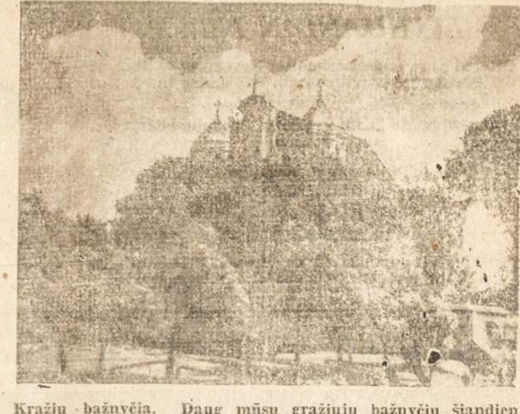
Kražių bažnyčia. Daug mūsų gražių bažnyčių šiandien paverstos pelonais arba išnikintos...