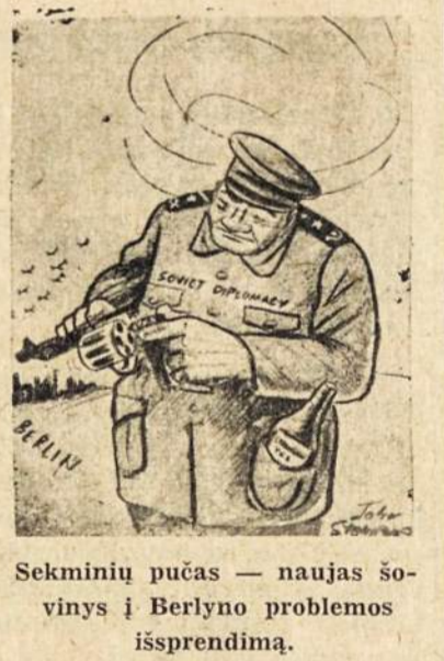
Sekminių pučas — naujas šovynis į Berlyno problemas išsprendimą.

Nuo tada prasidėjo vadinas "šaltasis karas", kuris tęsiasi iki šiol. Kadangi kiekviena kare vis vienas kuris lai-