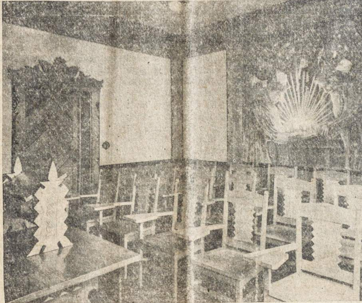
Lietuvių Tautinis Kambarys Pittsburgho universiteto rūmuose

Reikia pažymėti, jog tomis dienomis Puerto Rico valstybėje vyko sukilimas, kuriam vadovavo nacionalistai. Skelbiama, jog sukilimas buvęs komunistų inspiuruotas. Sukilimas šiuo metu jau numalšintas. Ryšium su sukilimu ir prezidento užpuolimu New Yorke ir pačiam Puerto Rico suareštuota per 500 žmonių. Jų tarpe yra