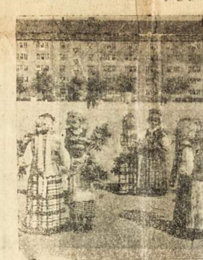
Lietuvių tautos ateitis — jos jaunimas ir vaikai. Čia matome būrelį mergaičių tremties stovykloje. Dar daug vaikelių kenčia varga ir skurda tremties stovyklose. Mūsų pareiga ištraukti juos iš ten ir padėti jiems išaugti tikrais lietuviais.

Mus stebina šiandien iš kur to meto lietuviai sėmė sau jėgų