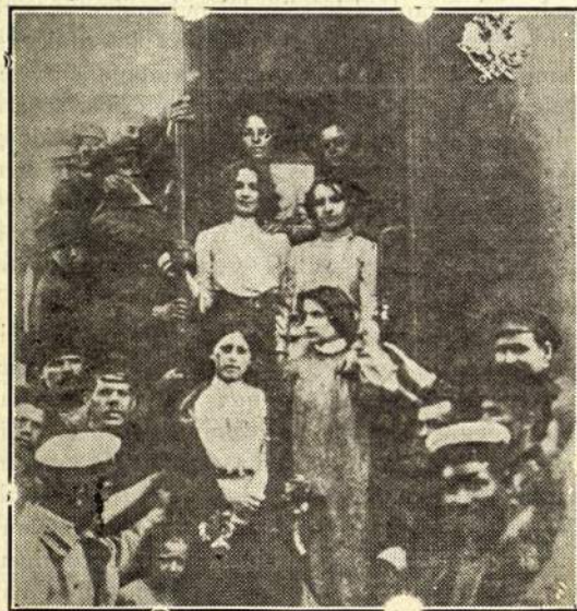
Socialistų revoliucionierių grupė, siunčiama į Sibiro kalėjimus po 1905 metų revoliucijos.