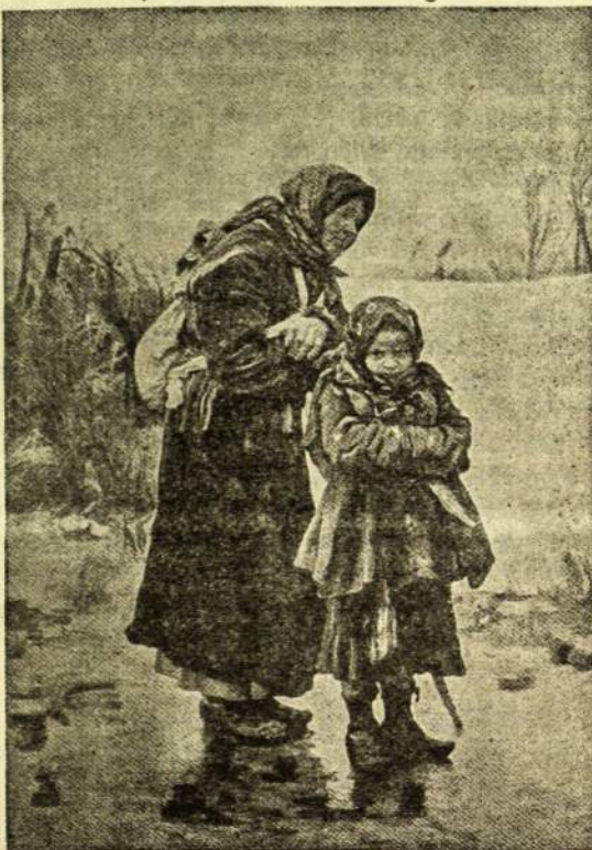
MOČIUTĖ IR ANUKĖ.