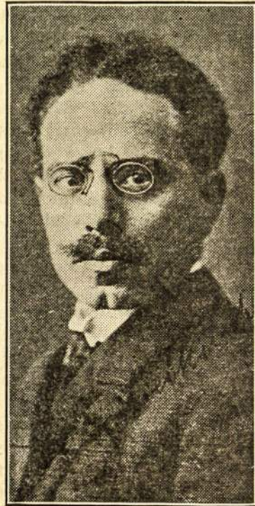
Dr. Karolius Liebknecht

saus Vokietijos revoliucionieriaus Wilhelmo Liebknechto, kuris dalyvavo dar 1848 metų revoliucijoj. Jis gimė tais metais, kada jo tėvas buvo kalėjime už pasipriešinimą Prusų valdžiai laike karės su francuzais. Pabaigęs advokato mokslus, Karolius Liebknechtas pradeda veikliai dalyvauti darbininkų judėjime ir visuomet jis eina kariųjų pusėje.