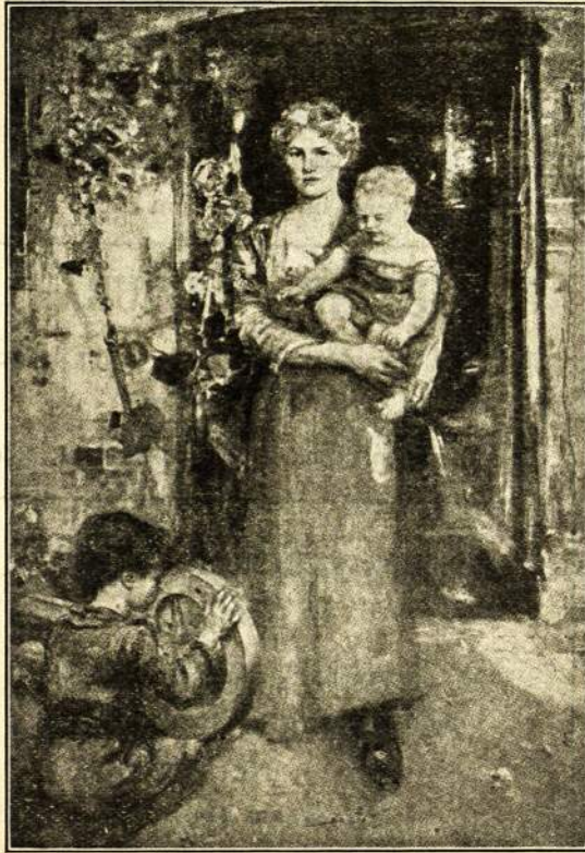
Vyrą karėn išleidis.

LIETUVIŲ LITERATŪROS CENTRALINIS ARCHYVAS Brooklyn, N. Y., U. S. A.