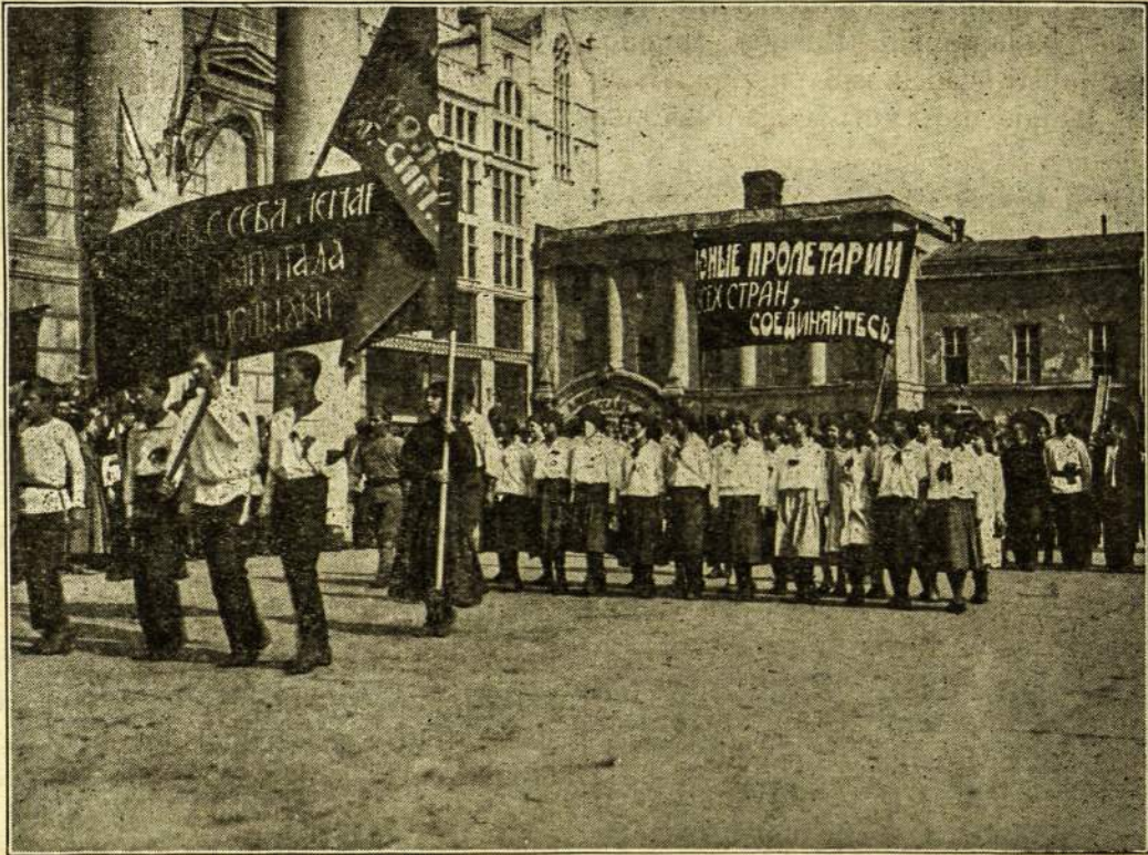
Jaunuolių Tarptautinė Diena Maskvoj.

paugę lapuotais medžiais, o iš abiejų gelžkelio pusių derlinga gerai išdirbta žemė, daug vaisių ir gyvulių. Traukinys vežė mus Besarabijos parubežiu. Odesos apie linkė lygi, derlingas juodžemis, laukuose dideli pulkai buvolų, didelės kviečių dirvos, dideli plotai kukuruzų, saulegrīžių ir dynų. Aplinkui Odesą yra ukiai vokiečių kolonistų, kurie yra reakcioniausi valstiečiai. Vos įvažiavus miestą, patėmijome daug stubų sugriautų iš priežasties amunicijos eksplozijos—vokiečiai tuomet buvo Odesoj.