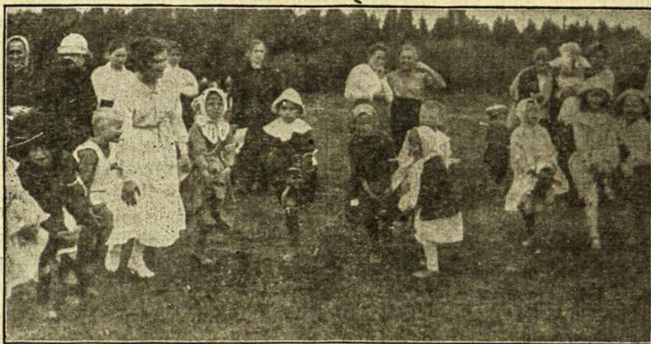
Vaičių diena Pirogovo miestely.