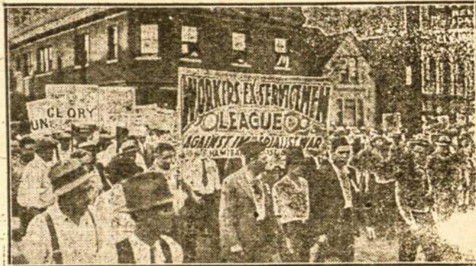
Dalis Didelės Rugsjūčio Pirmos demonstracijos Detroite. Matosi pasaulinio karo veteranai, kurie pasmerkė Hooverio karo žygius ir pasiryžę ginti Sovietų Sąjungą.

Jei ne Sovietų Sąjunga ir darbininkų judėjimas namie, galimas daiktas, kad kapitalistai susipjautų tarpusavyje už rinkas. Bet šitokiame momente, kada visame pasaulyje darbininkai sparčiai bruzda, kapitalistai turi griebtis priemonių, kurios, jų nuomone, "išgelbės" nuo viduji-