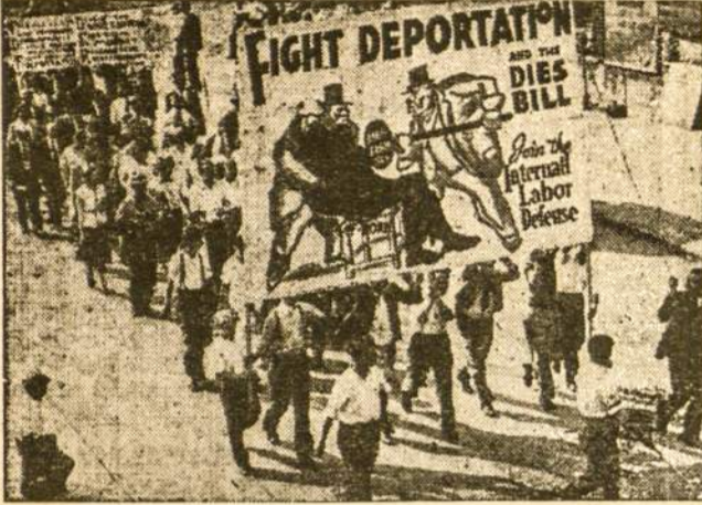
Deportuojamų kovingų darbininkų skaičius daugėja. Delto skubiai privalome stiprinti apsigynimo organizacijas, kad galėtume atmušti buržuazijos ataką.

Kapitalistų valdininkai leidžia vieną po kitam įstatymą varžymui ateivių darbininkų ir sulig jų areštuoja ateivius darbininkus pikietų linijose, masiniuose mitinguose, ofisuose ir namuose. Tokių areštų jau buvo daug ir jų