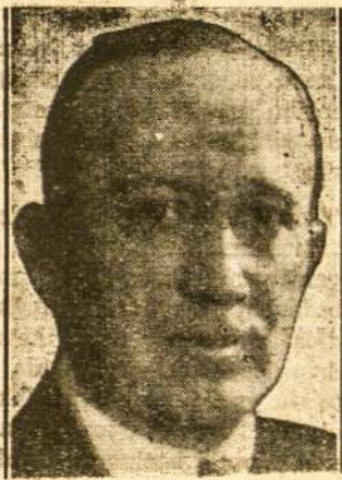
WILLIAM Z. FOSTER

Jungtinių Valstijų darbininkų klasė gyvena vieną didžiausių ekonominį krizių. Virš 13 milijonų vyrų ir moterų, norinčių ir galinčių dirbti, negali rasti darbų. Milionai vyrų, moterų ir vaikų kenčia alkį ir badą. Su didėjimu krizio, auga darbininkų klasės budrumas ir skatina atsilikusius sluoksnius prie klasinio susipratimo. Kuomet po mūsų akimis tūkstančiai kūdikių nedaugė, badmiriauja, alpsta nuo bado, tai šimtai galionų gero pieno išliepama į upes, kiaušiniai tiksliai mušami bolės vietoje, maisto sandėliai į jūras verčiami. Visa tai atidaro akis ne vienam ir verčia kiekvieną darbininką bei darbininkę prie klasinės sąmonės.