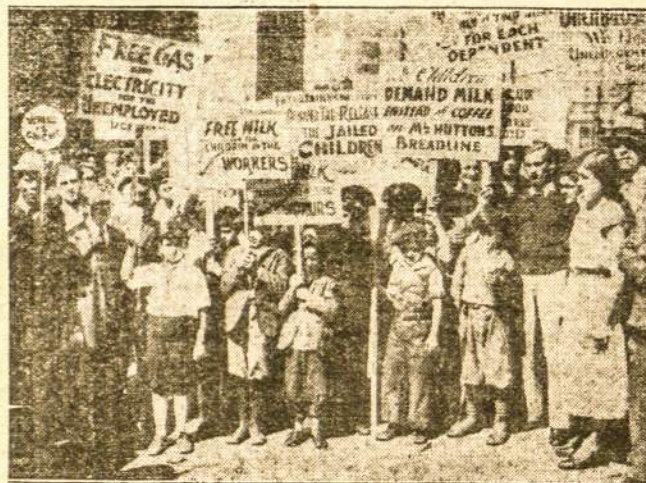
KOVOJA UŽ PAŠALPĄ SYKIU SU SAVO TĖVAIS

Grupės organizuotų fermerių iš Pennsylvania, New Jersey ir Nebraska, užgyrė maršavimą į Washingtoną į nacionalę konferenciją, pasmerkdami Farm Holiday, Farm Bureau, Grange ir kitas organizacijas, už priešinimasi veikimui.