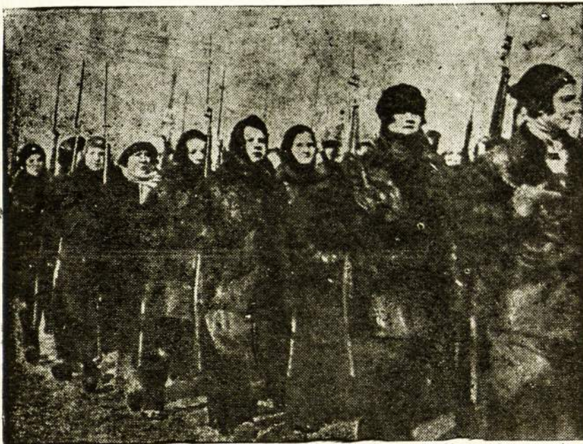
Sovietų moterys trokšta taikos, bet jos gatavos gintis

Šalin imperialistų suokalbis ir kruvinos ran- kos nuo Sovietų Sąjungos!