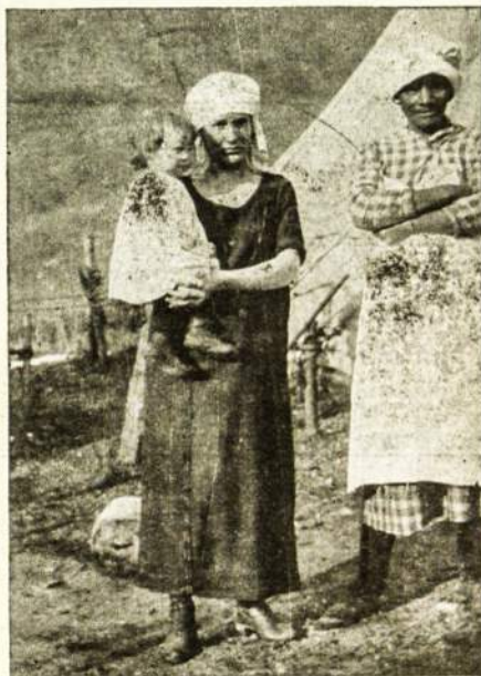
Streikuojančių Mainierių žmonos

Tad darbininkėms reikia mesti į šalį visokius buržuazijos įkalbėtus skirtumus. Lietuvos darbininkes reikia plačiau supažindinti su LDSA. siekiais, o susipažinusios, jos pamatys, kad ši organizacija yra dėl jų labo. Jos pamatys, kad Darbininkų Balsas, Laisvė ir Vilmis nėra kokie palaidi barščiai, tarnaujanti buržuazijai, bet kad juos kontroliuoja Lenino Partija, vienintėlė pačių darbininkų partija, kuri gina darbo žmonių reikalus. Ir vajaus laiku ir po vajaus reikia visom ir visiems sulig išgalės darbuotis, kad gavus narių LDSA. organizacijai ir skaitytojų Darbininkų Balsui.