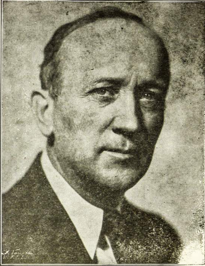
WILLIAM Z. FOSTER, Komunistų Partijos kandidatas į A. J. V. prezidentus

Drąsiai ir garsiai nacionalė darbininkų klasės konvencija, kurią sušaukė Komunistų Partija nominavimui kandidatų į Jungtinių Valstijų prezidentus ir vice-prezidentus, iškėlė sekamus kovos obalsius šiuose rinkimuose: