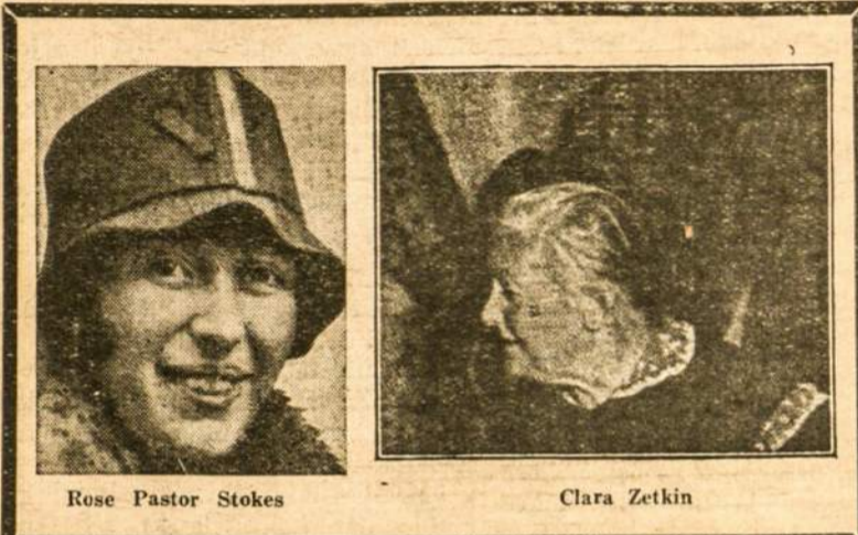
Rose Pastor Stokes