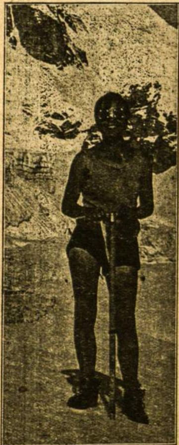
Sovietų Sąjungos darbininkė atletė keliauja per snieguotus kalnus. Mums sakoma, kad S. Sąjungoj badas. Ar galėtumėt būdami išbadėje taip keliaut?