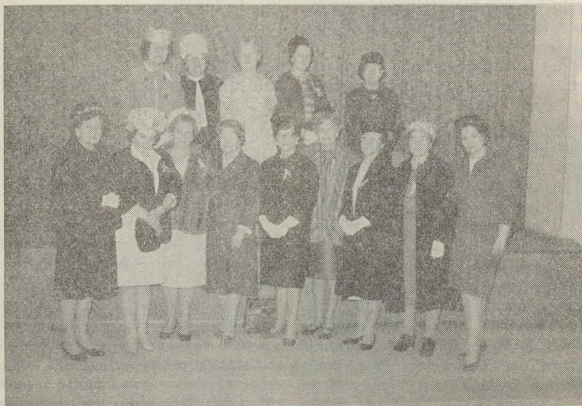
Naujosios Anglijos Apygardos suvažiavimo, įvykusio balandžio mėn. 21 d., 5-tos kuopos globoje, Worcester, Mass., dalis dalyvių, bet ne visos.