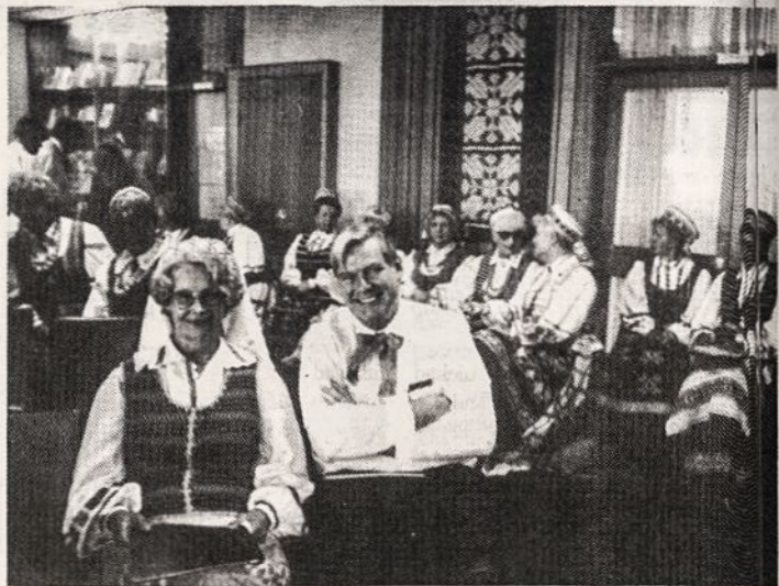
Concerto programos pertraukos metu Sydnejaus Lietuvių klube.