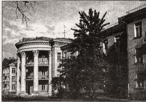
„Draugystės“ sanatorijos pastatas Druskininkuose.

Taigi jaukiai įsikūrus galima kreiptis į gydytojus. Sanatorijoje gydomas širdies ligos, virškinimo sistemos sutrikimai. Yra naujausia medicininė aparatūra, pagaminta Japonijoje, Vokietijoje. Taigi už tą pačią 30 dol. kainą