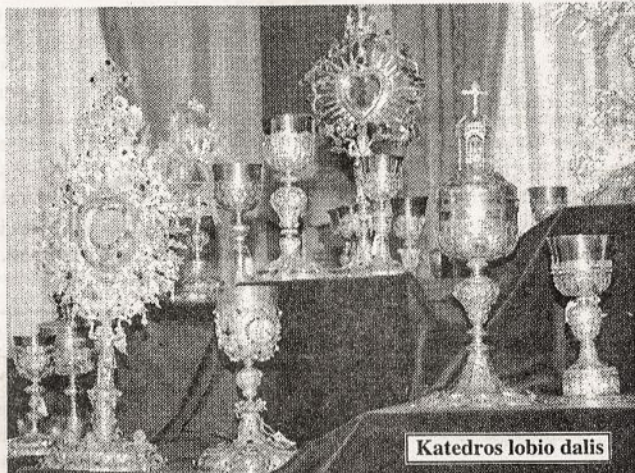
Katedros lobio dalis

Prieš tryliką metų - 1985-ųjų kovo 27 dieną - restauruojant Vilniaus Katedrą, kuri tuomet buvo paversta į Paveikslų galeriją, buvo rastas lobynas - apie 270 brangakmeniais išpuoštų auksinių, sidabrinųjų taurių, monstrancijų, relikvijorių ir kitokių daiktų, kuriuos sukūrė garsiausi XVI - XIX amžiaus Europos auksakaliai.