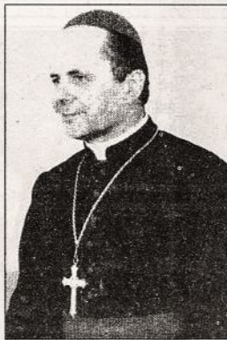
Kauno arkivyskupas Sigitas Tamkevičius

tyta apie 6 000 kūdikių ir suaugusiųjų, sakramentiniam gyvenimui parengti 8109 vaikai, sutuokta 2 250 porų, palaidoti 5 284 žmonės. Sekmadieniais šv. Mišiose nuolat dalyvauja apie 50 000 tikinčiųjų, kurie vyskupijos reikmėms 1997 m. paaukojo apie 913 000 litų. Kauno arkivyskupijos kurija iš parapijų gavo 402 982 Lt., kuriuos panaudojo Kauno Tarpdieceizinei kunigų seminarijai, Jaunimo centro veiklai, sergantiems kunigams, parapijoms parenti.