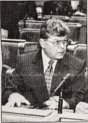
Krašto apsaugos ministras Česlovas Stankevičius

Lietuvos Krašto apsaugos ministras Česlovas Stankevičius paaiškino, kad