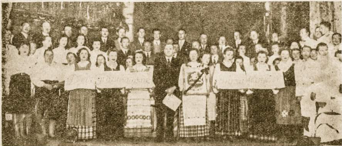
Šv. Cecilijos Choras su Tautinių Šokių ansamblio dalyviais Tautos šventės metu Lietuvių Salėje Avellanedoje 1948 m. rugsėjo 19 d.

Argentinos pavasario sutikimas . Rugsėjo 26 d., sekmadienį, Lietuvių Salėje Avellanedoje buvo atšvėstas lietuviškas Argentinos pavasario sutikimas, kurį suorganizavo lietuviškosios radio valandėlės „Lietuvos Aidai“ vadovybė. Šalia vykusiai parengtų įvairenybių svarbiausią programos dalį užėmė šaunus šv. Cecilijos choro koncertas, muziko V. Rymavičiaus diriguojamas. Gausi publika buvo suža-