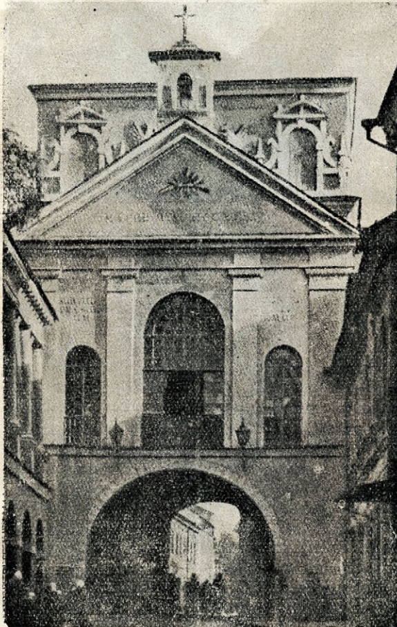
Aušros Vartai Vilniuje.

Pati garsiausioji ir visai lietuvių tautai brangiausioji yra Aušros Vartų Marijos šventovė, kurios metinė šventė yra švenčiama lapkričio 21 d. Nuo neatmenamų laikų žvelgia nuostabiai meilingas skausmingosios Dievo Motinos paveikslas iš kaplyčios, pastatytos