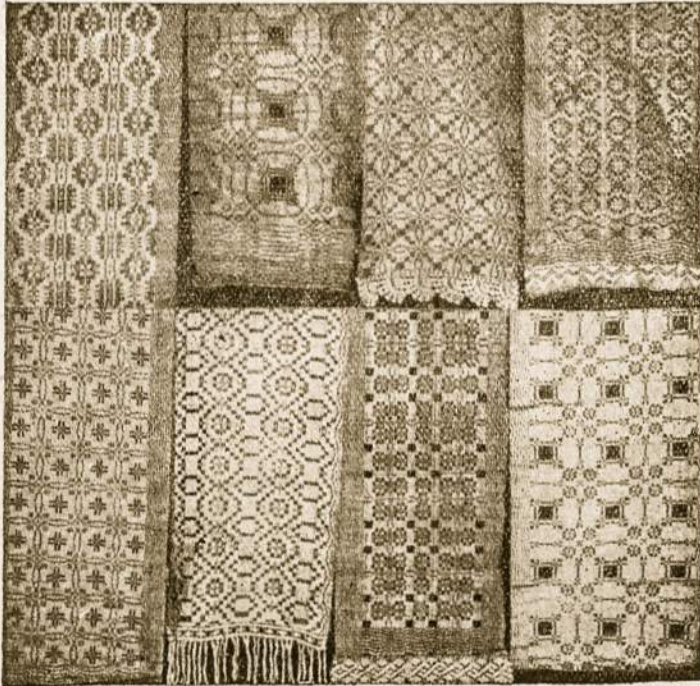
Namų darbo rankšluosčiai, išmarginti tautiniais raštais.

O kaip mums lietuviams, taip toli nuo savo tėvynės nuklydusiems tie rūbai turi būti brangūs! Kiekviena jų spalva mums primena ką nors iš to mylimo krašto: ar tai gintarinį mūsų pajūrį, žalsvas Baltijos bangas, ar rugiagėlių spalvos dangų ir žaliąsias pievas, auksinius rugių laukus, rausvus bijūnus ir kitas gėles žydinčias mūsų sodų darželiuose. Kaip būtų gražu, jei kiekviena lietuvė turėtų gražius tautiškus rūbus ir nesivaržytų jų dėvėti kiekviena tinkama proga. Žinoma, kaip jau anksčiau minėta, tie rūbai turi būti tinkamai pasiūti, suderinti pagal mūsų liaudies menininkų taisykles. Kai jie bus skoningai pasiūti ir priderinti, tada jie bus dėvimi su dideliu malonumu ir džiaugsmu, o kartu džiugins ir visų kitų žmonių akis. Nė viena tauta nesigėdina savo tautiškų drabužių, kodėl mes turėtume jų drovėtis, jei jie yra pripažinti esant tikrai vieni iš gražiausių?