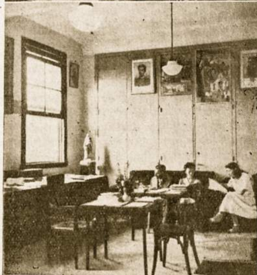
"Laiko" skaitykla Redakcijos patalpose.