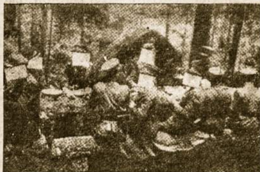
Puota miške, surušta Partizanų Karo Mokyklos kariūnų laidai pagerbti karininko laipsnio suteikimo proga (Tauro apygarda Lietuvoje).

Vėl pasidarė ramu. Pirmiausiai jis galvojo bėgti