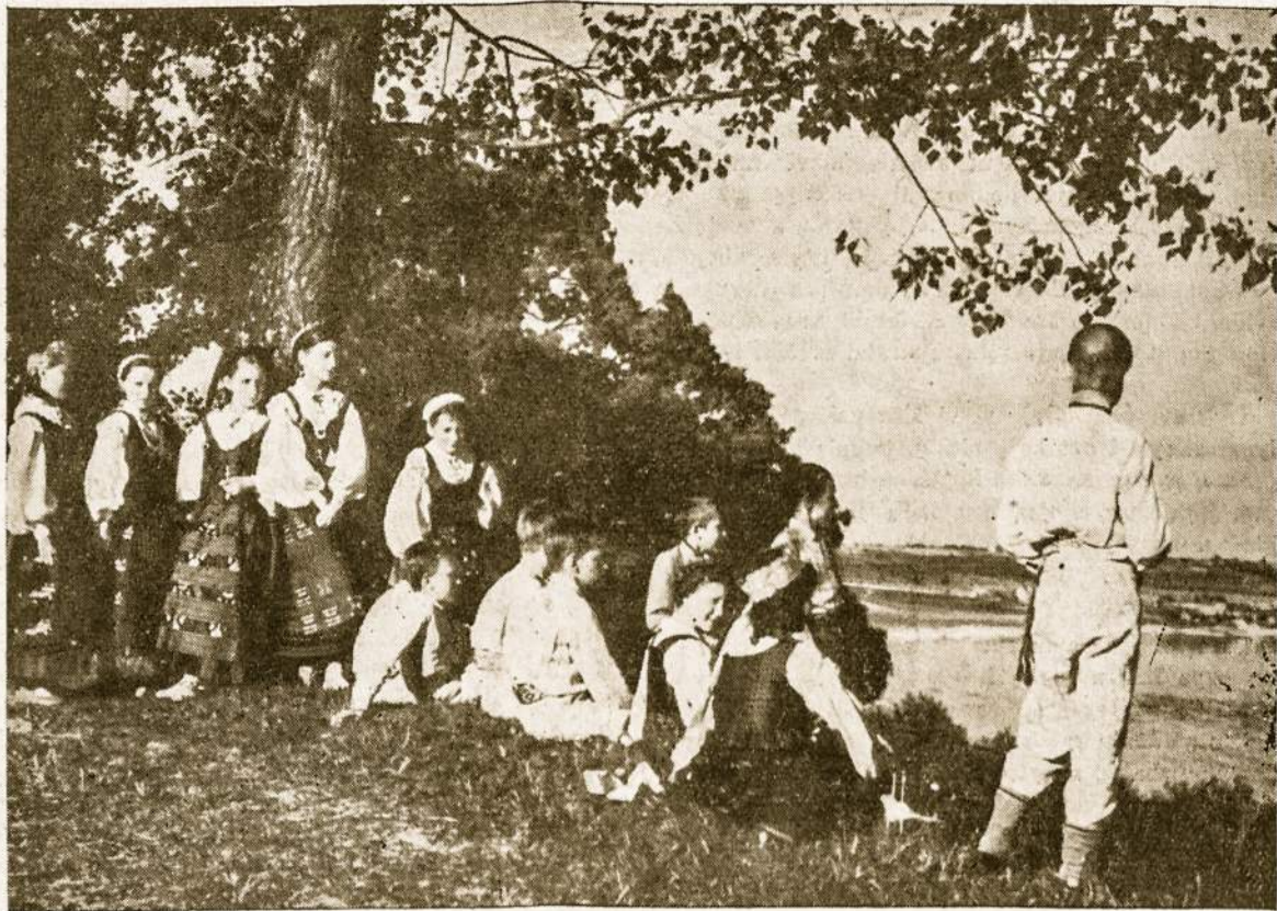
Ten kur Nemunas banguoja tarp kalnų, lankų...

Išnyksta toliai drebančiame dienovidyje. Iš užu piliakalnio išsoka vieškelis, kuriame net dulkės tingi pasikelti, nesulaukdamos nei vėjo, nei žlegančios raštuotos lineikos.