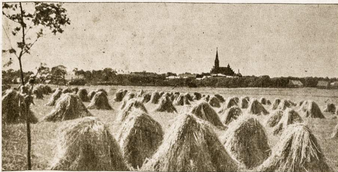
Rugiapiūtė gražioj Lietuvoj (Zarasų apylinkė)

"ŠIENAPIŪTĖS" SPEKTAKLIAI ĮVYKS: rugpiūčio 6. d. Avellanedoj, rugsėjo 10 d. Rosario, spalių 8 d. Berisse.