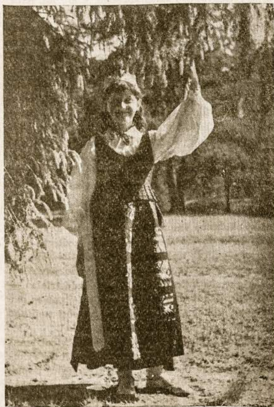
Viršuj: Laisvosios Lietuvos jaunimas Nemuno pakrantėse prie Kauno.

Pastaba: šį kartą po filmų bus šokiai ir veiks turtingas bufetas, kad būtų progos geriau atsikvėpti, pasikalbėti ir pasidžiaugti savųjų tarpe.