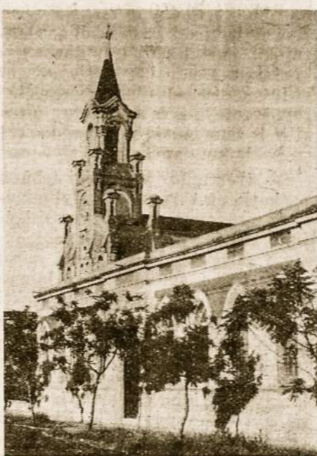
"Buen Pastor" koplyčia (Rosario), kur vyksta liet. pamaldos.