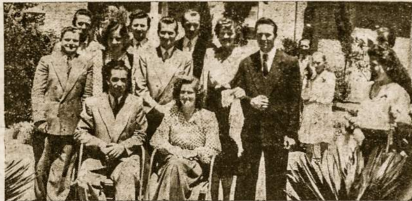
Dabartinė Vyčių valdyba

Kaip iš trumpo mūsų veikimo aprašymo matyti, darbo buvo padaryta nemaža, atsizvelgiant į sunkias sąlygas, mūsų organizacija vystėsi ir dirbo, pergalėdama įvairias kliūtis.