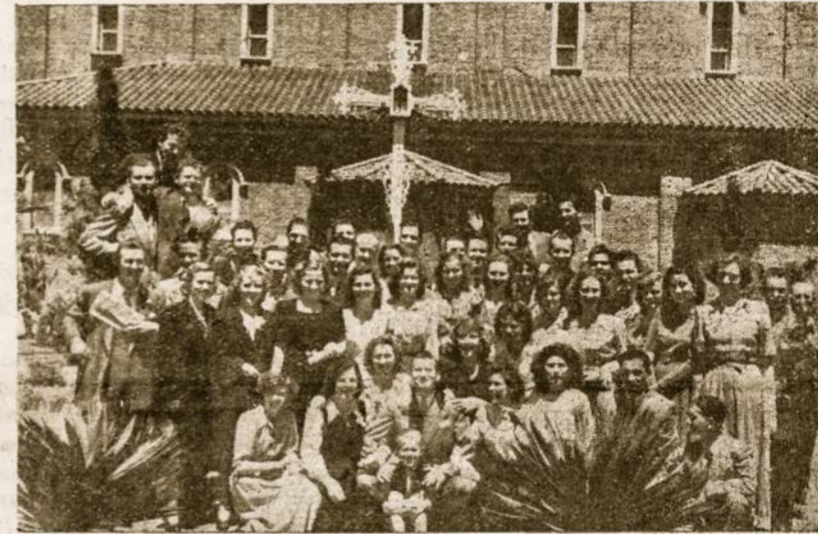
Vyčiai savo metinės šventės ir 3 metų gyvavimo proga 1949 m. lapkričio 27 d. Lietuvių Aušros Vartų par. sode.

Reiksdama širdingą padėką, "LAIKO" Redakcija ir Administracija linki prityrusiam Urugvajaus Lietuvių Dvasios Vadui ilgą ir vaisingą metų.