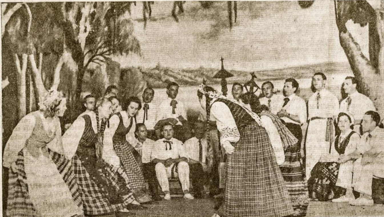
Tautinis Ansamblis šoka "Andėjėlė" Lietuvių Salėje Avella nedoje š. metų Vasario 16 proga. Dekoracijos dail. R. Kuprevičiaus. (Foto Pablo).