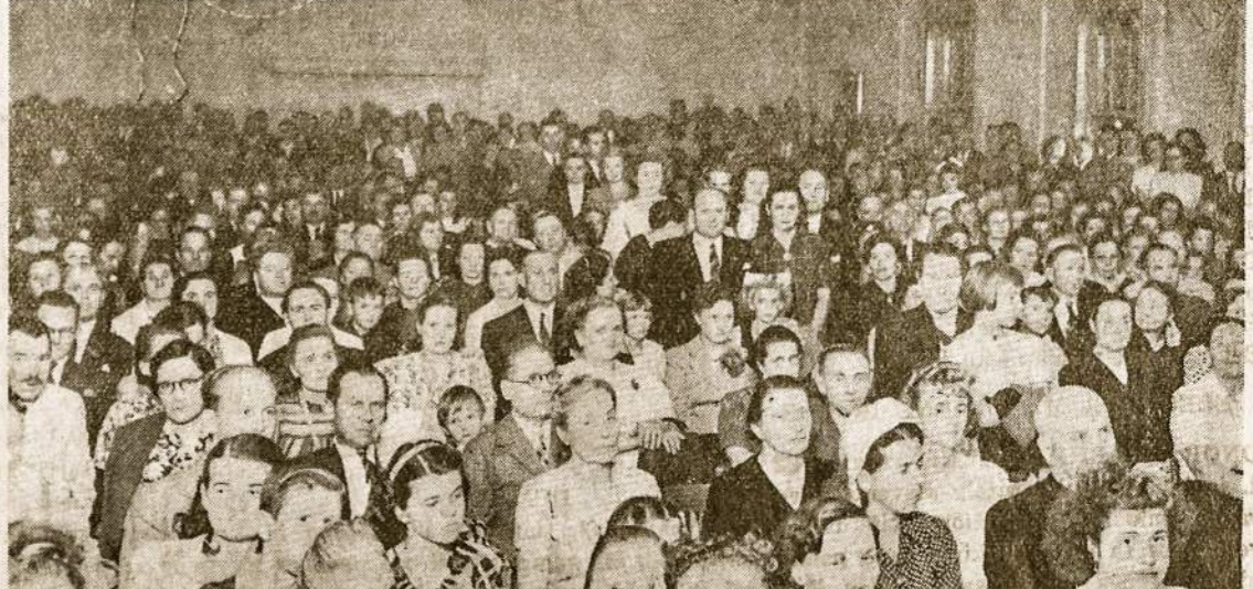
Vaidai iš Vasario 16 minėjimo: Viršuje: Eisena iš Plaza Mayo į Katedrą padėti vainiko ant gen. San Martín kapo. Apačioj: šv. Cecilijos Choras pradeda minėjimą ir dalyviai Lietuvių salėje.