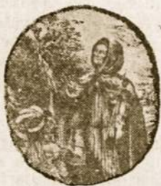
SAN FRANCISCO SOLANO.

gyvenęs prie Buenos Aires, kur dabar kuriasi jo vardo miestas.