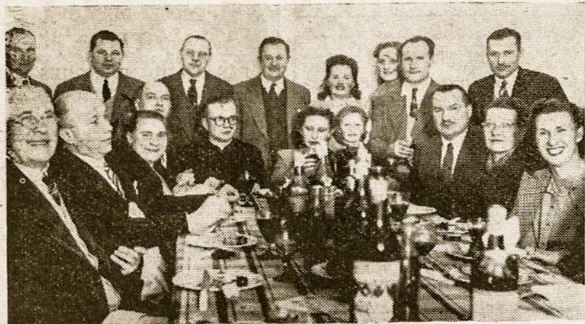
Promoninkų pp. Čikštų svečiai 1950. VI. 24, šeiminko ir sūnaus joninių progą.

A. L. Jaunimo Draugija ir "Lietuvos Aidas" Radio Valandėlė