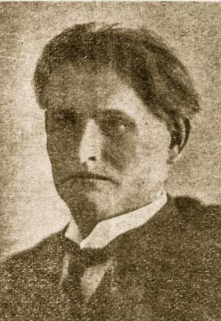
Nors Dr. K. Grinius visą laiką buvo kairiojo sparno žmogus (valstietis liaudininkas), bet savo gilia tolerancija užsitarnavo pa-

vus, apeliavo į jų sąžines, primindamas savo tėvynės kančias, kalbėjo per radio, primindamas pavergtųjų tautų tragediją. Rašė lietuviams, išsisklaidžiusiems visame pasaulyje, ragindamas juos stoti į bendrą ir vieningą kovą už Lietuvos prisikėlimą ir pats tuo giliai tikėjo. Tačiau įsisenėjusio vėžio liga ir prie to prisidėjusios kitos ligos bei senatvė pakirto jo nuo darbų išvargusį kūną. Jis paliko žmoną, du sūnus ir jo gedinčią tautą. Jo kūną priglaudė svetima žemė.