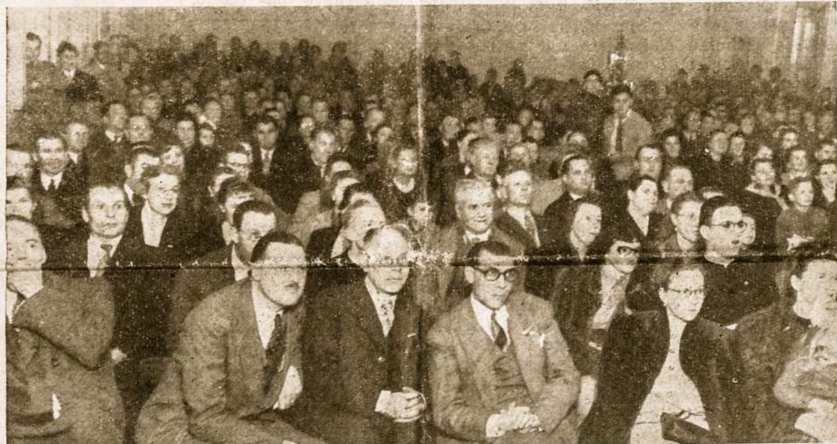
Tautos Gedulo Dienos dalyviai žiūri J. Gilvydžio rodomos do kumentinės filmos apie bolševikų žudynes Lietuvoje 1950. VI. 18 Lietuvių Salėje, Avellanedoje. Platesnis minėjimo aprašymas 2 psl.

Birželio 29 d. Pietinės Korėjos kariuomenė, amerikiečių skraidančių tvirtovių remiama, kontraatakavo komunistus, atsėmė Kimpo aerodromą, priartėjo prie Seul priemiesių ir užėmė pozicijas prie Han upės. 183 kartus birželio 29 d. pakilo amerikiečių lėktuvai, bombarduodami tiltus, tankus, sunkvežimius, traukinius, patrankas, miestus, jų tarpe ir komunistų sostinę. Karo laivai apšaudė komunistų užimtas pakrantes ir vežė kariuomenę su ginklais.