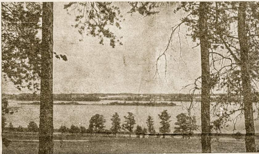
Gražioji tėvynė: Nemunas arti Kauno

—Gelbėk, Kristau!... Anglija, 1950.VIII.19.