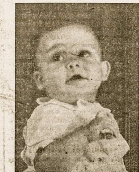
Foto "PABLO" ★ FOTOS EN ESTUDIO Y A DOMICILIO ★ COPIAS REPRODUCCIONES AMPLIACIONES ★ VENTA DE ROLLOS ★ PASAJE CHICAGO 982 Media cuadra de la Parroquia

LIETUVIŠKAS KEDŽIŲ FABRIKAS Gaminamos tvirtos ir stilingos kėdės pagal užsakymą: viešbučiams, kavinėms, raštinėms, krautuvėms ir privatiems butams Bronius Eidukonis Savininkas Salta 265, Sarandí. T. E. 22-5461