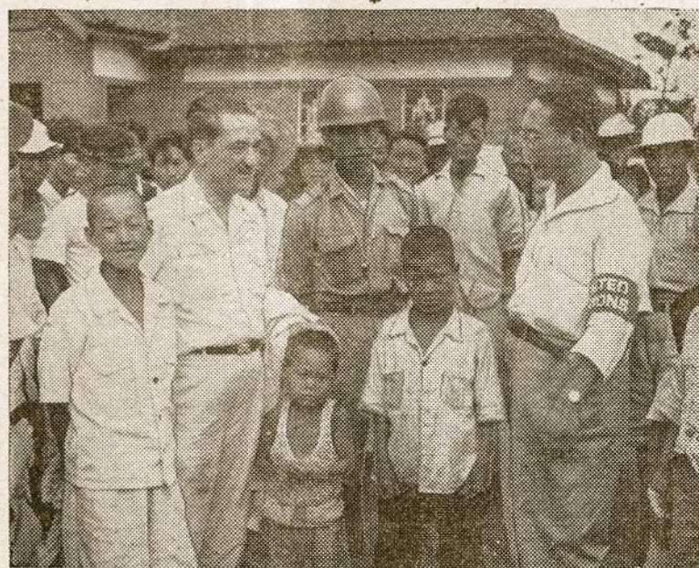
Korėjos gyventojai mėgsta draugauti su amerikiečiais.