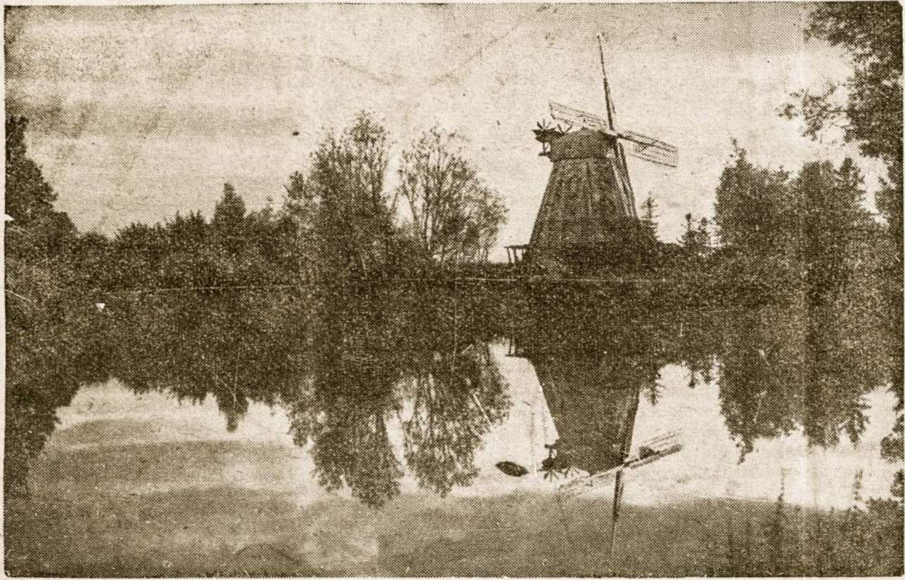
Gražioji Lietuva: senas malūnas prie tvenkinio.

kinęs, jog vakarų sąjungininkai nėra pasiruošę atlaikyti visuotinį sovietų puolimą ir todėl trečiojo karo atveju galės likti neutralūs. Jis taip pat neabejoja, kad nė jo turimoji vieno milijono vyrų armija, apginkluota pasenusiais ginklais, negalėsianti sulaukyti bolševikų antplūdžio prie Pirinėjų kalnų.