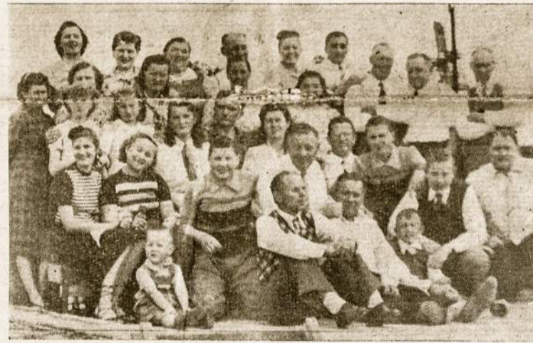
Gerb. Baltušių svečiai 1950.XI.24, Villa Scasso

čiulevičiai ir daug kitų. Turi du sūnus (12 ir 15 metų), kurie pažyzdingai auklėjami lietuviškoje dvasioje, domisi lietuvišku kolonijos gyvenimu ir namie gražiai kalba lietuviškai.