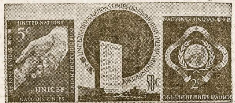
Jungtinių Tautų Organizacija New Yorke turi savo paštą ir jau išleido šiuos savo pirmuosius pašto ženklus.

Rugsėjo 10 d. Prancūzijos parlamentas, po 13 dienų užtrukusių karštų debatų, pagaliau priėmė įstatymo projektą (322 balsais prieš 251), sutenkinantį valstybinę paramą privatinėms (daugiausia katalikiškoms) mokykloms. Per metus privačios Prancūzijos mokyklos gaus 15.000.000.000 frankų (apie 50.000.000 dolerių) valstybinę pašalpos.