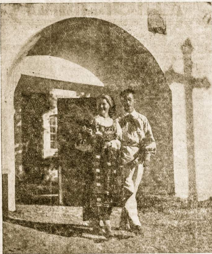
IS BAZNYČIOS: Laisvosios Lietuvos prisiminimas...

Liaudininkų spauda anksčiau ir dabar dangstydama "nepartiskumu", kaip į-mandama juodina sau nepatogų 1926 m. sukilimą, bet beveik priskiria liau-dininkų nuopelnui 1941 metų sukilimą. Tačiau istorija atrinks pelus nuo grūdų ir aiškiai parodys, kad abiejų tautos su-kilimų prieš Kremliaus užmačias pry-šakyje stovėjo katalikai. Tie patys ka-talikai ir šiandie daugiausia neša partizano dalią tėvynės miškuose. Pasieku-sios laisvajį pasaulį žinios liudija, kad partizanų vadai į savo eiles beveik ne-priima kitokių, kaip religingų vyrų. Tie gi, kurie jau paliko katalikiškąjį tautos kaminą ir, prisimetę prie svetimų in-ternacionalų, drįsta katalikiškąją tau-tos daugumą pravardžiuoti "sektantais" ir kitais bolševikų vartojamais termi-nais, tegu geriau prisimena savo netoli-mą praėitį ir liaujasi katalikiškąją tau-tos daugumą vedę iš kantrybės. Iš Sau-lių retai pasidarau Pauliai. Arba geros valios bendradarbiavimas, arba — šalin suptas rankas nuo švento Lietuvos va-davimo darbo!