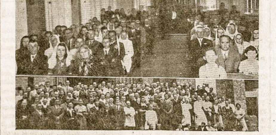
Rosario lietuvių misijų vaidai.