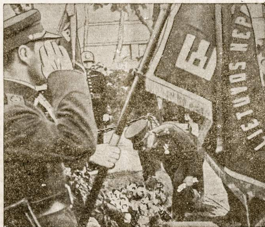
Laisvosios Lietuvos kariuomenė prie Nežinomo Kareivio kapo Vasario 16 d. Kaune, Vytauto Didžiojo Muzėjaus sodyje.

Vasario 6 d. 8 val. ryto staiga pasimirė Anglijos karalius Jurgis VI.