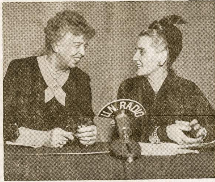
E. Rooseveltienė J. T. Organizacijoje aiškina žmogaus teisę