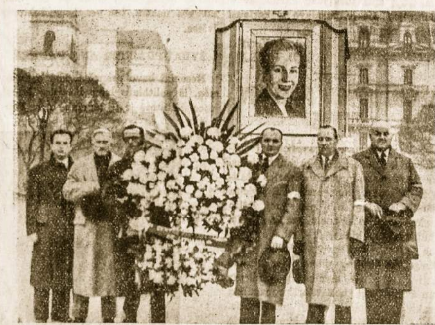
Liet. Išl. Centro atstovai, padėję lietuvių vardu vainiką prie EVA PERON karsto