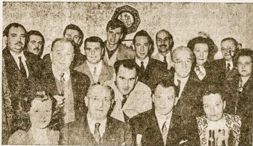
VIKTORAS CIESLINSKAS (sėdi antras iš deš.), mūsų žymusis krepšininkas, artimųjų tarpe. Prie jo sėdi jo tėvai ir sesutė.