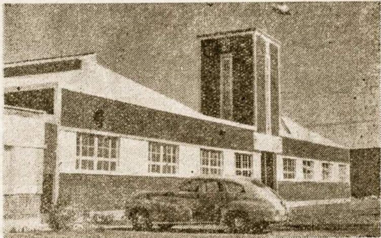
Moderniškas p. VI. Urbiečio fabrikas Mercedes mieste. Lapkričio 8 d. fabrikas ir fabriko kieme kopytėtė su iškilėmis buvo pašventinti.

Mes gerbėme savo kariuomenę laisvoje Lietuvoje. Mes prisimindavome garbingai už laisvę žuvusius savo Tautos sūnus. Ir ši diena, lapkričio 23-čioji, mums ir dabar yra garbinga, didi ir nepamirštama. Ji yra glaudžiai susijusi su dabartimi, su mūsų kovojančia tauta ir jos kariais, tebededančiais savo kankių ir kraujo aukas tėvynėje ir kituose pasaulio frontuose prieš tą patį Lietuvos ir visos žmonijos priešą.