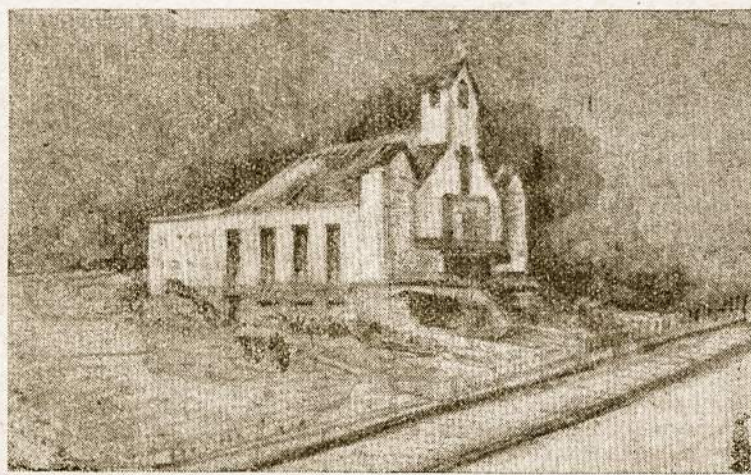
Montevideo lietuvių naujosios bažnyčios projektas

Čikagos miestas yra labai išsidėstęs į platumą. Kai kas lygina jį su Bs. As., bet tokio palyginimo būti negali. Buenos Aires yra daugiau suspaustas, su modernišku centru ir vargingais priemiesčiais. Čikagos gi priemiesčiai Cicero ir Berwyn yra lyg etnografinis miesto centras, su švariais ir gražiais gyvenamais kvartalais. Čikagos miestą labai ištesia automobiliams pastatyti įrengtos aikštės, plačios gatvės, vienai šeimai pritaikyti gyvenami namai. Be abejo, Čikagos centre yra ir milžiniškų namų, bet, apskritai, gatvės yra išstėtos nedideliais namais, kurie nėra labai suspausti vieni prie kitų.