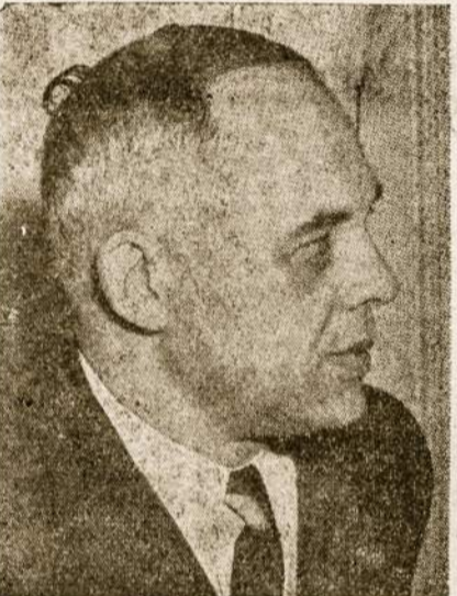
Prof. Juozas Brazaitis

Kritika Brazaičiui ne tik pripažino jam įgimtą nuoseklumą, sistemą, laisvą medžiagos apvaldymą, bet ir didelį originalumą, kad jis, taikydamas lietuvių rašytojams psichologinį ir estetinį formalinį metodą, atskleidė daug nauja (žid. 27, p. 569). Atsisakęs nuo pozityvistinio metodo, o perėjęs prie sociologinio,