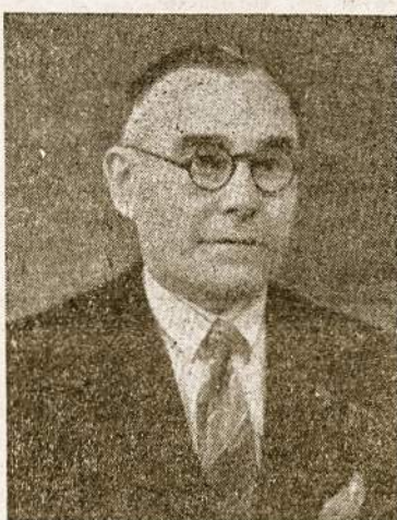
J. Intas naujasis "Mindaugo" Dr-jos pirm.