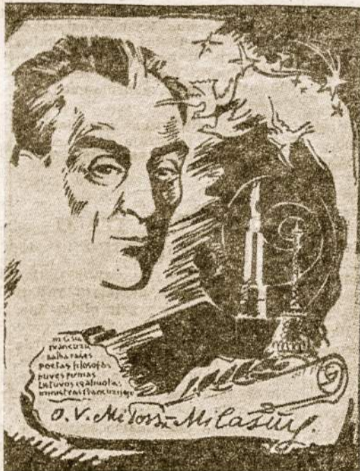
Poetas Oskaras W. L. Milašius.