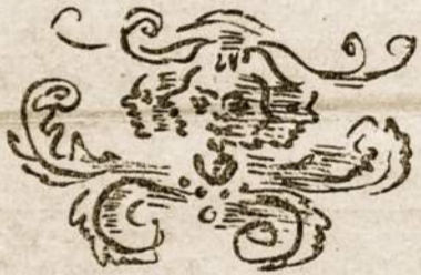
Piešinius darė dail. K. Janulis

(Moterų kūnai vėjuotam danguj plevėsuoja lyg totalinis skausmas žemės, kurios vaisiai reiškia meilės ir gyvybės mirtį).