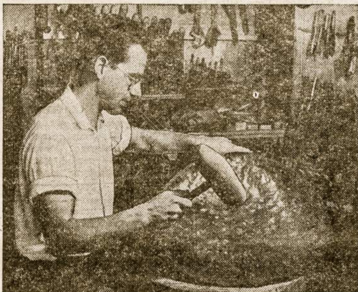
Brazilijos studentas mokosi dirbti vario gaminius.

Bendra politinė padėtis yra laukimo būklėje. Niekas netiki didesnių rezultatų iš Berlyno konferencijos, bet laukia, kas bus, kai ji užsibaigs. Tuo tarpu Syrijoje prasidėjo sukilimas prieš dabartinio prezidento valdžią. Egiptas daro valymus viduje ir kovoja prieš anglus. Ispanai susipyko su prancūzais dėl Moroko, o patys morokiečiai pešasi tarp savęs dėl buvusio ir esamo sultono. Indokinijoje po didesnių prancūzų laimėjimų kovos šiek tiek aprimo, bet laukiama naujų puolimų iš komunistų pusės. Taikos nėra, kraujas liejasi, o keturi „didieji“ pradėjo naują vaidinimą sugriauto ir į keturias dalis padalinto Berlyno scenoje. — P. S.