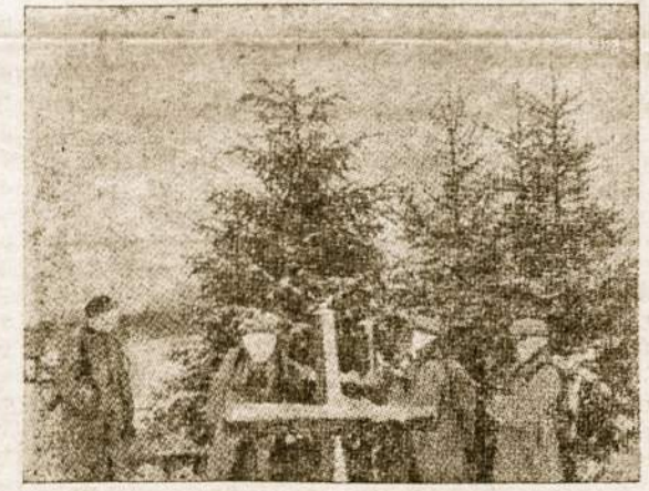
Mūsų savanoriai apgynė Lietuvos laisvę 1918-21 m., o dabartiniai savanoriai - partizanai ją gina prieš dabartinius okupantus.

nes. Prancūzai, kurie nuo šio karo jau yra labai pavargę, mėgina pravesti savo teigimą, jog jie vieni negali kariauti. Gal dėl to Vakarų atstovai sutinka balandžio 15 d. Šveicarijoje pradėti derybas su kom. Kinija, bet su sąlyga, kad derybose dalyvautų ir trys laisvosios Indokinijos valstybės, būtent Laos, Vietnamas ir Combodija. Gal dar bus prie derybų stalo pasodintos ir abi Korėjos, bet dėl jų labai nespėjama. O Pietų Korėjos prezidentas pasiūlė savo dalinius padėti vesti karą prieš komunistus. Ar tas nepakenks