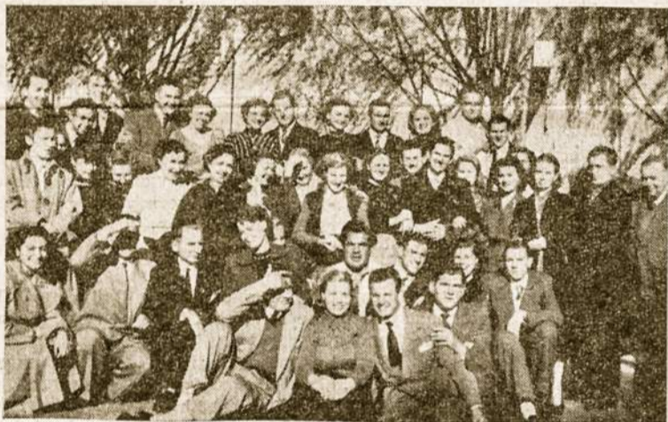
Rosario Lietuvos jaunimo ekskursija kartu su Buenos Aires Lietuvos jaunimu Aušros Vartų parapijos sodely.

Maskvai vis labiau plečiant savo įtaką, Vakarai pradeda vėl derinti savo nuomones. Jau ir patys anglai prisipažino, kad jie derins savo politiką su visų vakariečių ir ypatingai JAV-bių politika. Prancūzai juo labiau linksta į amerikiečių pusę, nežiūrint viso Prancūzijos komunistų fronto pasipriešinimo. Italija besąlyginiai eina su Amerika. Tai gal labiau sustvirtins Vakarus ir, reikalui esant, pasakys griežtesnį žodį Kremliui. Kremlius skaitosi tik su tokiais žodžiu, kuris yra aiškiai paremtas jėgos persvara. O visi Vakarai kartu turėtų didesnę persvarą, kurios kaip tik Maskva labiausiai bijo. — P. S.