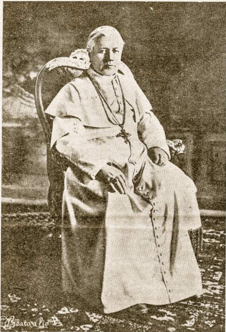
PIJUS X, kuris gegužės 29 d. bus paskelbtas šventuoju.

Prieš darydamas įgesę, savo laisvę Mantuvos miesto valdybai, vysk. Sarto be kitko parašė: „Naujasis vyskupas, nors beturtis, bet turtingos širdies, trokšta tik sienų išganymo ir nori sudaryti vieną draugišką ir brolišką šeimą“. Tuo (Nukelta į 6 psl.).