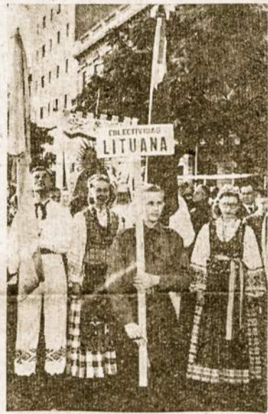
Lietuvių eisenos pradžia Buenos Aires gatvėse š. m. gegužės 30 d., Matosi užrašas, Lietuvos trispalvė ir tautiniai drabužiai apsirengusiųjų dalis.

Indokinija yra tik Korėjos pakartojimas. Tik tas skirtumas, kad čia komunistams geriau sekasi kovos lauke. Vakariečiai nenori ir negali užleisti savo labai svarbių bazių, o komunistai nesileis prie jokių susitarimų, kol jie galės eiti pir-