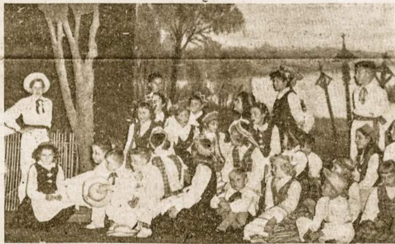
Lietuvių vaikai, atostogavę Villa del Dique, ir šešt. Mokyklos vaikai, dalyvavę Liet. Prek. ir Pram. S-gos vakaro programoj Liet. Salėje

Abu žymieji sportininkai domisi lietuviams kituose kraštuose. Būdami Argentinoje jie aplankė Aušros Vartų parapiją, Lietuvių Salę, parodė sportinį meną naujų sporto aikštelių ir pasidžiaugė lietuvių kultūrinio bei religinio centru. Birželio 8 d. svečiai išvyko į Chile, iš kur vyks į Perų, Venecuėlą, Cubą, Costa Ricą, Panamą ir birželio 24 d. grįž į Chicago.