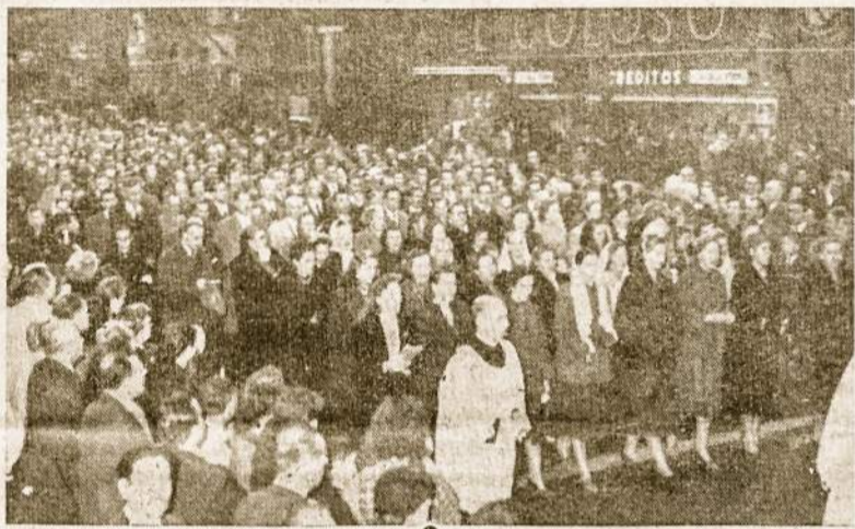
Šv. Cecelijos choro nariai ir kiti mūsų tautiečiai tautų eisenos metu.

-rusų karas; Prancūzijos valdžia išleido įstatymą, atskiriantį Bažnyčią nuo valstybės; Ispanijoje, Portugalijoje ir Meksikoje vyko Bažnyčios persekiojimai; filosofinis ir teologinis „modernizmas“ vis labiau šakojosi katalikiškoje bendruomenėje. Vieną dieną paklaustas kodėl jis tuoj nebaudžia modernizmo vadų, Pijus X atsakė: „Dievas irgi galėjo tuoj po Adomo puolimo atsijusti Išganytoją, bet Jis leido pasauliui laukti tūkstančių metų, kaipgi tad aš, Kristaus Vėtininkas, galū tuokius svarbius sprendimus be gilesnio apgalvojimo daryti“. 1906 m. konskruodamas 14 Prancūzijos vyskupų šv. Petro bazilikoje, Pijus X pareiškė: „Jūs nekviečiau džiaugsmui, bet kryžiumi“. Duodamas kiekvienam vyskupui kryžių pareiškė: