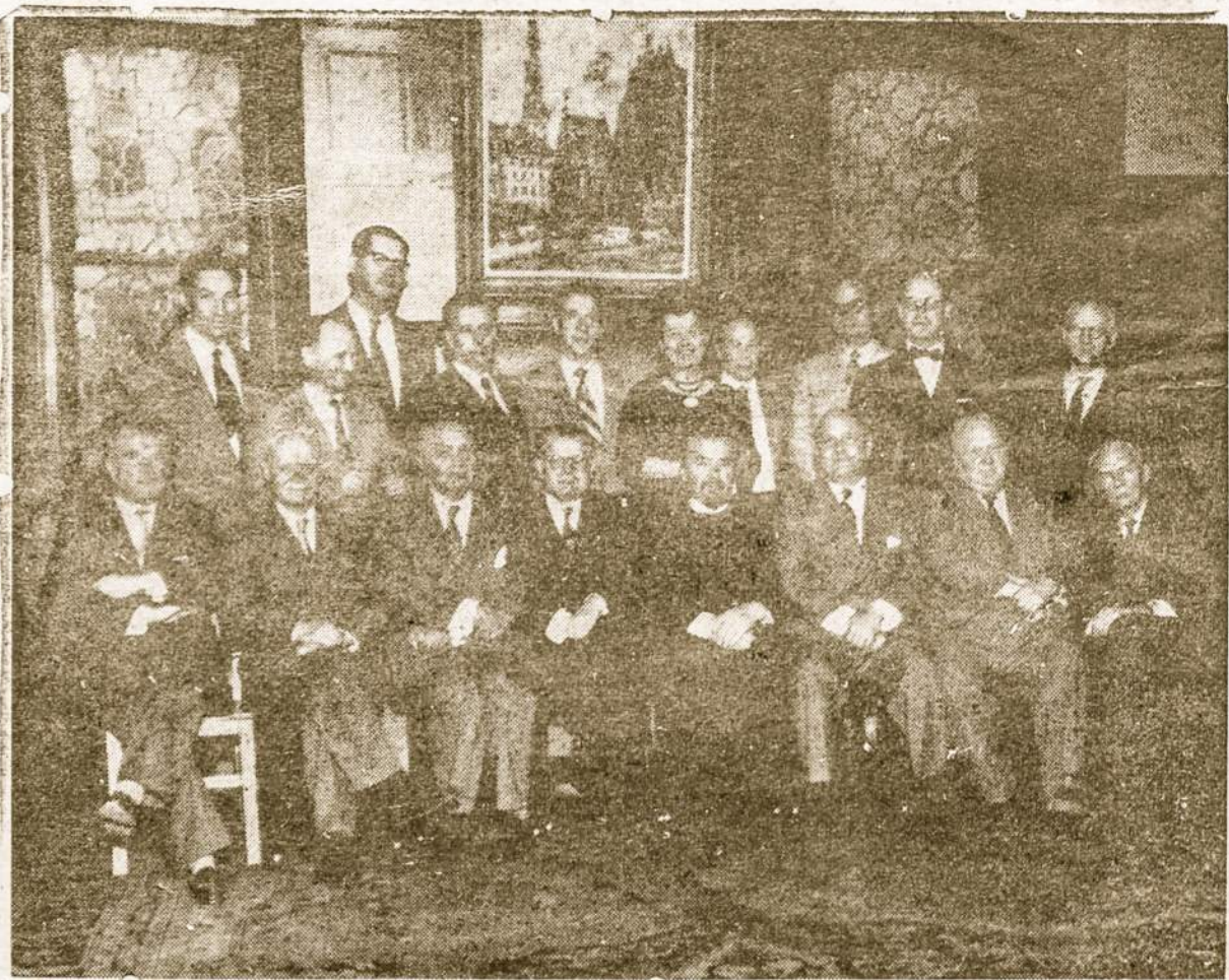
LIETUVOS LAISVINIMO VEIKSNIŲ KONFERENCIJA

Šis fabrikas yra 9 km atstume nuo Comodoro Rivadavia ir galės pagaminti iki 400 tonų cemento per dieną, o tai padengs visus Patagonijos ir net kitų krašto rinkų poreikavimus.