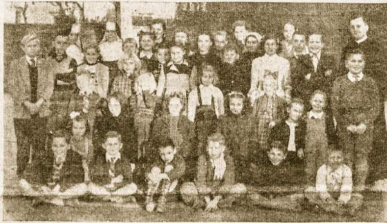
Šeštadieninės Lietuvių Mokyklos Avellanedoje mokiniai su savo mokytojais.