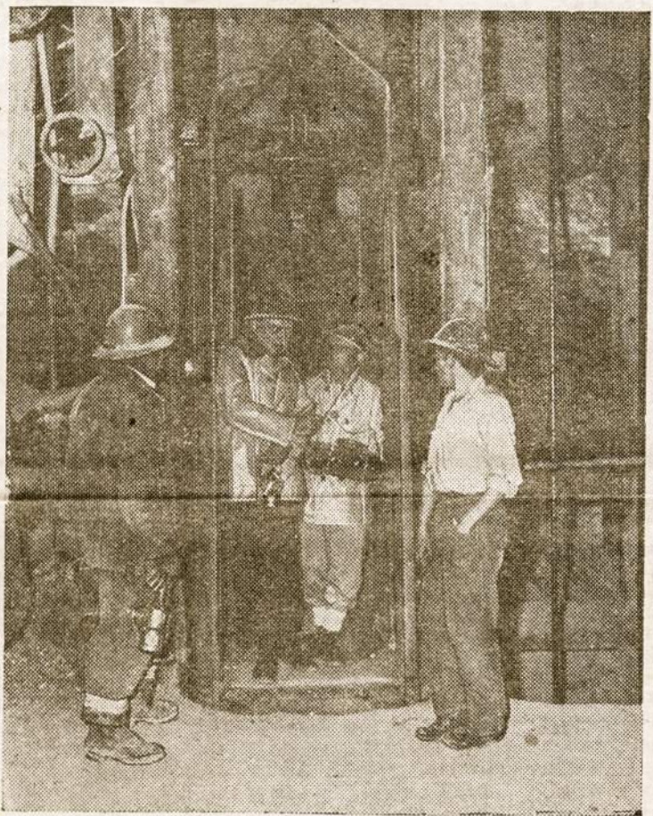
J. T. atstovas moko boliviečius moderniosios technikos.