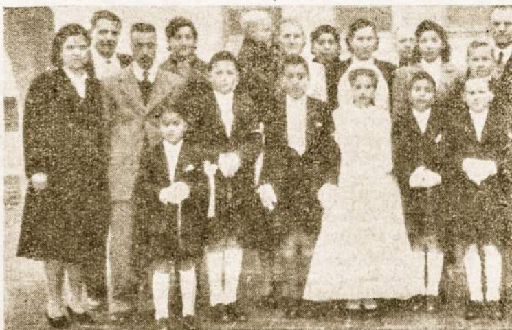
Pirmieji vaikai, priėmę Pirmąją Komuniją Rosario Šv. Kazimiero bažnyčioje.