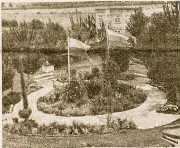
Prie neseniai įsteigto Lietuvos Konsulato Kolumbijoje plevėsuoja lietuviška vėliava.

kinijos nesiseka. „Neutralių“ komisija tarp savęs nesutaria ir net graso iš Indijos persikelti į portugalų kolonijas. Tarp Indijos ir Portugalijos eina kol kas dar tik tyli kova už šios pastarosios kolonijas, į kurias pretenzijas reiškia Indija. Diplomatinė kova visame pasaulyje labai gyva, ypač ją išvystė amerikiečiai iš vienos pusės ir Maskva — iš kitos. Maskva net nori naujos konferencijos, kuriai mažiausiai pritaria amerikiečiai. Didesnių sukrėtimų galima laukti kiekvienu metu, bet, politinių komentatorių aiškinimu, jie bus panašūs tikrai į Korėjos ir Indokinijos karus. Visuotiniams karui dar neatėjęs laikas, — jam esą reikalinga, kad vieni ar antri išdrįstų pulti tiesioginius priešus. Bet, atrodo, kad tiek amerikiečiai, tiek rusai tokį karą išsukti dar ne-drįsta. P. S.